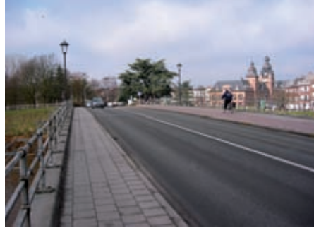
Cordon sanitaire doorbroken?

Sterker nog. Daar waar het Vlaams Belang de enige partij was die ronduit tegen een ringweg rond Duffel én tegen een tweede Netebrug was, maar met het voorstel om de huidige Netebrug te vervangen door een driebaanvaks-Netebrug, doet de SPA plots alsof zij dé oplossing gevonden heeft voor een vlotte verkeersdoorstroming in Duffel en propageert plots het idee van het Vlaams Belang: een driebaanvaks-Netebrug!